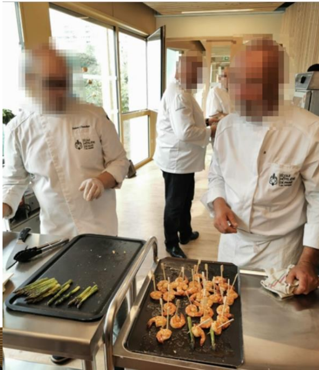
Animation organisée en août 2019 avec l'Ecole Hôtelière de Paris/CFA Médéric